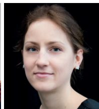
Liga Korne (Klavier)