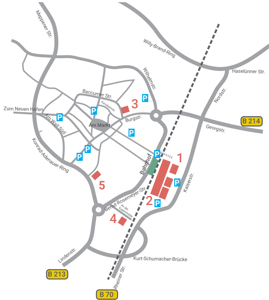
Stadtplan mit Hochschulgebäuden