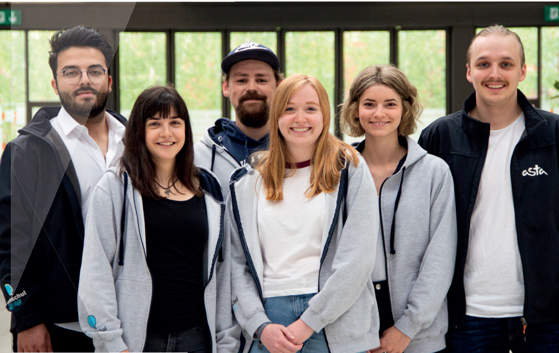
Bild: Die studentischen Vertreter des Allgemeinen Studierendenausschusses (AStA)

»Die Arbeit in Gremien ist für mich die ultimative Form das Studentenleben auszukosten. Das Amt im AStA ermöglicht mir, mich gesamtheitlich mit dem Studierendenleben und speziell mit studentischen Belangen auseinanderzusetzen. Die Erfahrungen die ich dadurch bisher sammeln konnte, möchte ich gegen nichts eintauschen.«