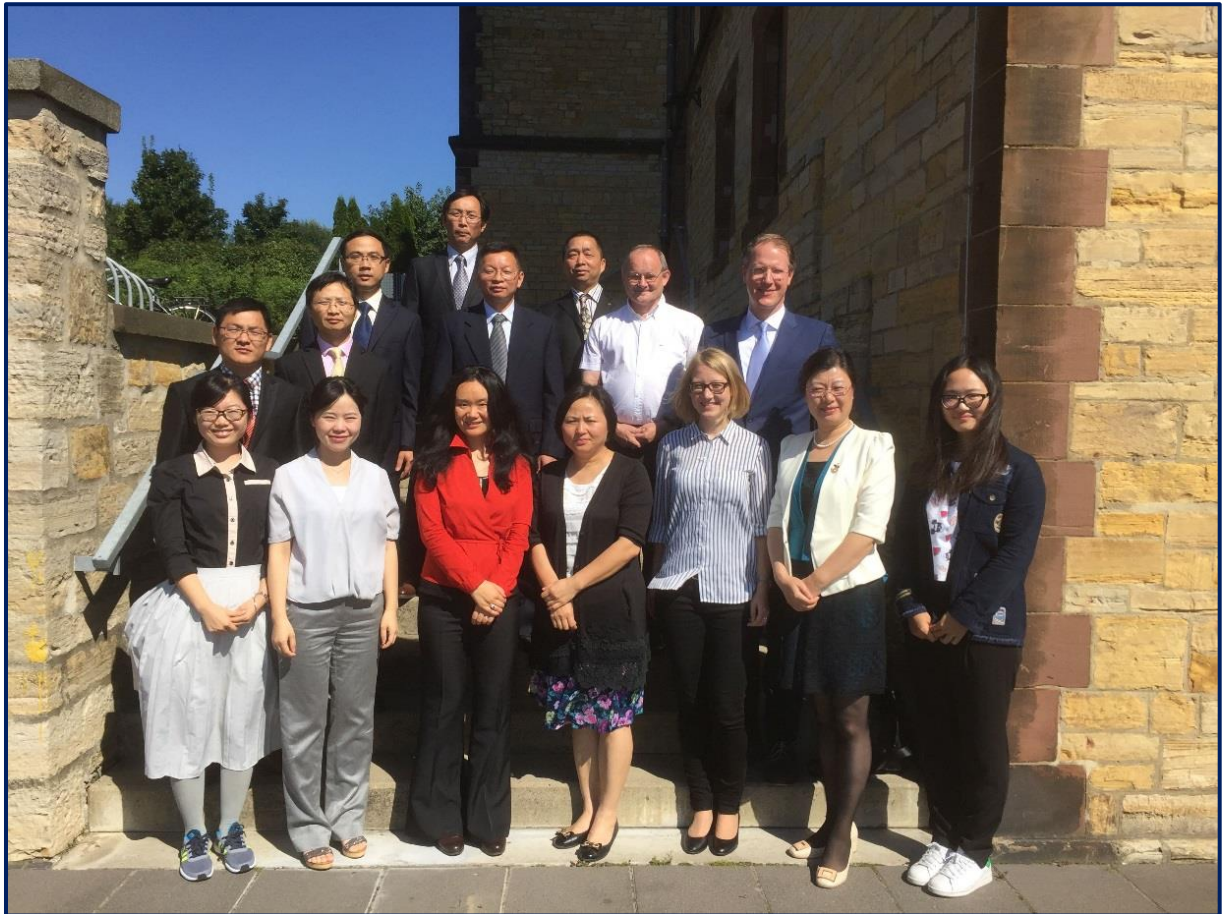
Siebte Weiterbildungsdelegation der Hefei Universität