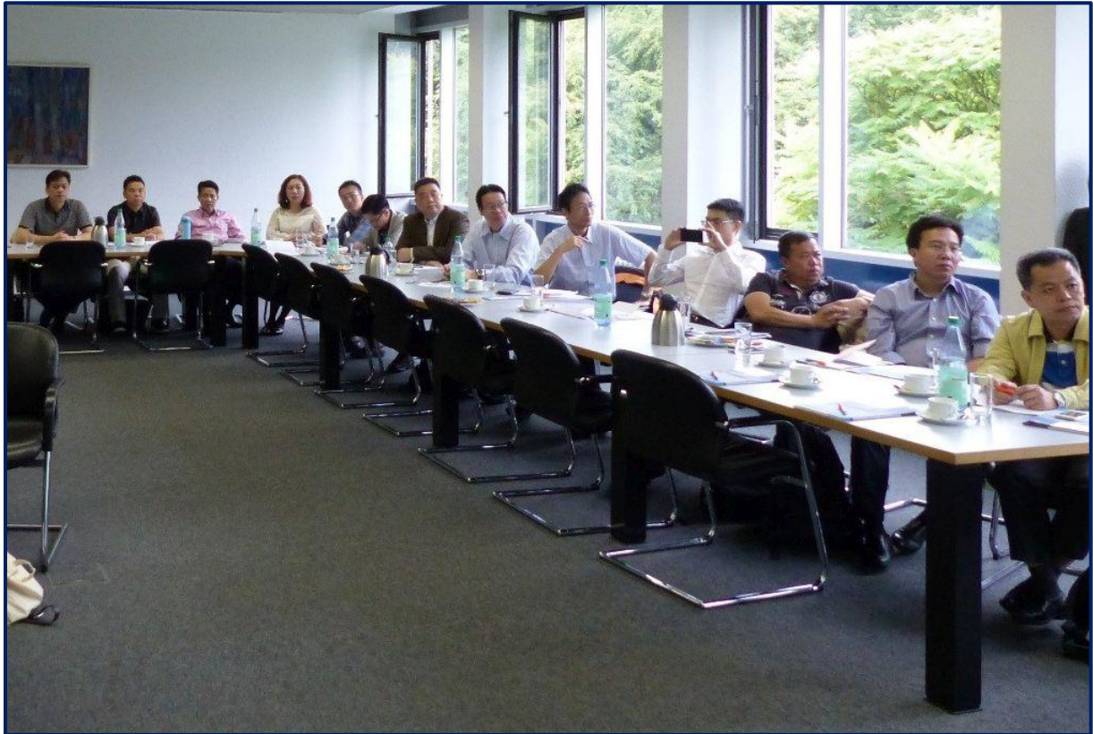
Vertreter der Stadt Foshan und junge Unternehmer aus der Region Foshan informierten sich über Industrie 4.0 an der Hochschule

Am 9. September 2016 empfing die Hochschule Osnabrück über 25 Gäste aus der südchinesischen Stadt Foshan. Die Delegation setzte sich aus Jungunternehmern aus Foshan sowie Vertretern der Kommunalverwaltung zusammen. Bei dem Besuch informierten sich die Delegationsteilnehmer über Projekte zum Thema Industrie 4.0 an der Hochschule Osnabrück.