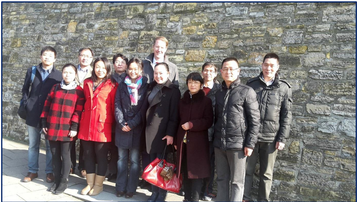
Sechste Weiterbildungsgruppe der Hefei University

Im Februar 2016 führte das HZC die sechste Weiterbildung zum Thema „Modularisierung des Curriculums“ für die Hefei University durch. Zehn Professorinnen und Professoren besuchten die einwöchige Fortbildungsveranstaltung, in der sie sich Grundlagen zur Strukturierung von Curricula, Modulgestaltung und Verknüpfung von Theorie und Praxis aneigneten.