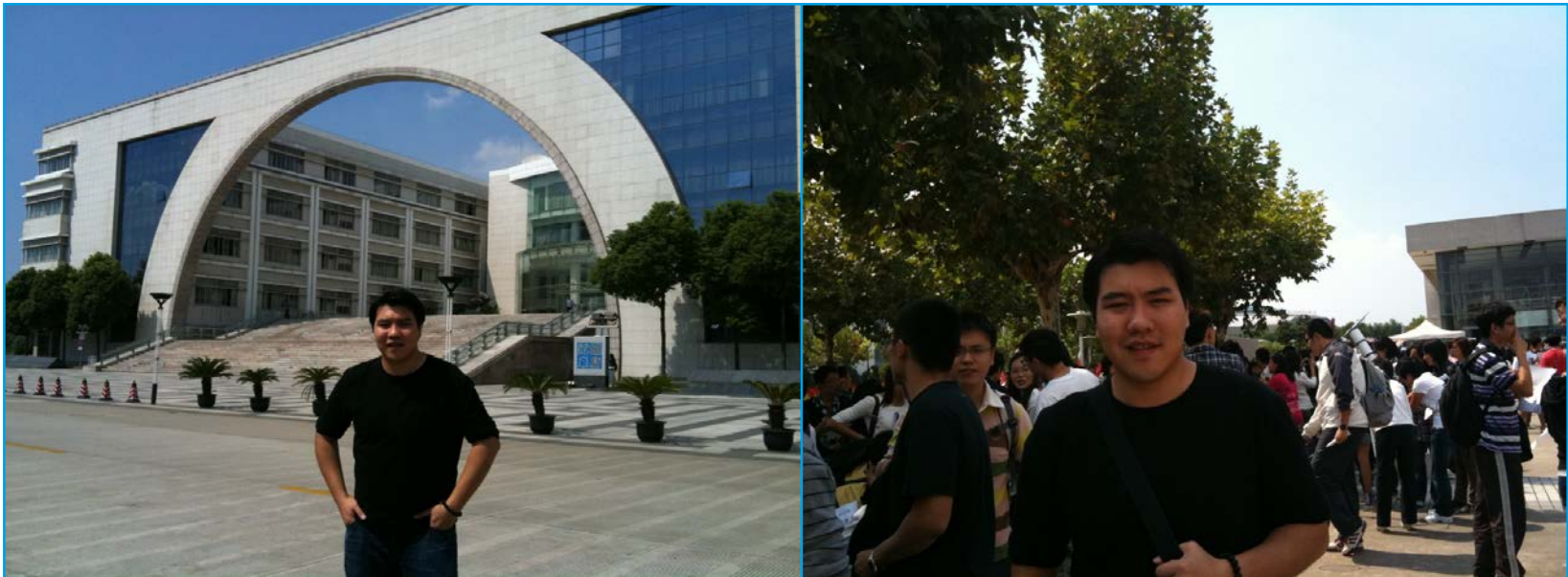
Waiky Wong, Student der Hochschule Osnabrück in Shanghai im WS 2011/2012