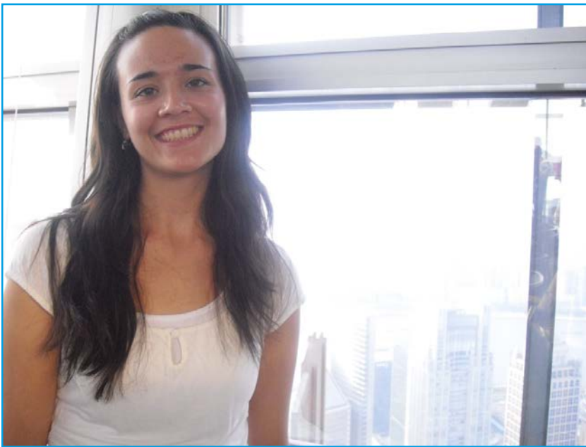
Im 82. Stock des Jinmao Towers

„Nicht nur die Aussicht die du vom Jinmao Tower aus hast ist großartig, sondern die Aussicht, dass du die beste und spannendste Zeit deines Lebens in Shanghai haben wirst ist großartiger!“