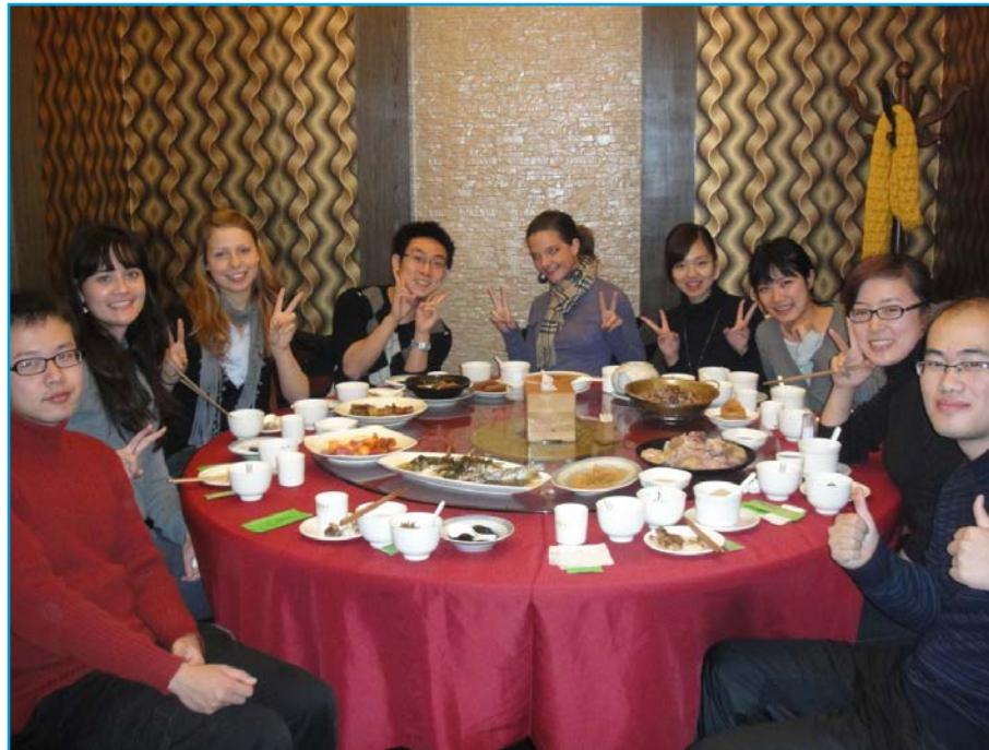
SIFT und HSOS Austausch-Studenten gemeinsam beim Essen in Shanghai im Dezember 2009