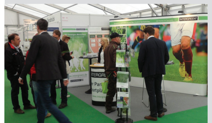
Messestand der INTERGREEN AG auf der Demopark in Eisenach

Projektbearbeitung Dr.-Ing. Verena Stengel