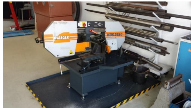
Abb. I: Bandsäge Übersicht